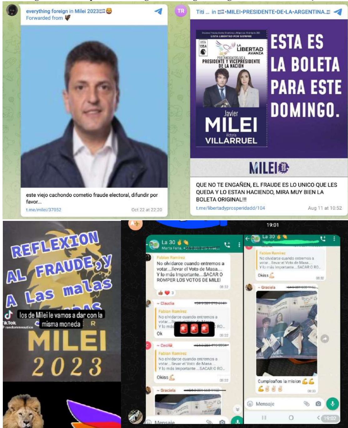
Figura 1 - Exemplos de mensagens no Telegram alegando fraude nas eleições

que a campanha efetivamente começa, o discurso de fraude vai se tornando cada vez mais argentino. Na Figura 1 apresentamos exemplos de postagens compartilhadas nas comunidades do Telegram.